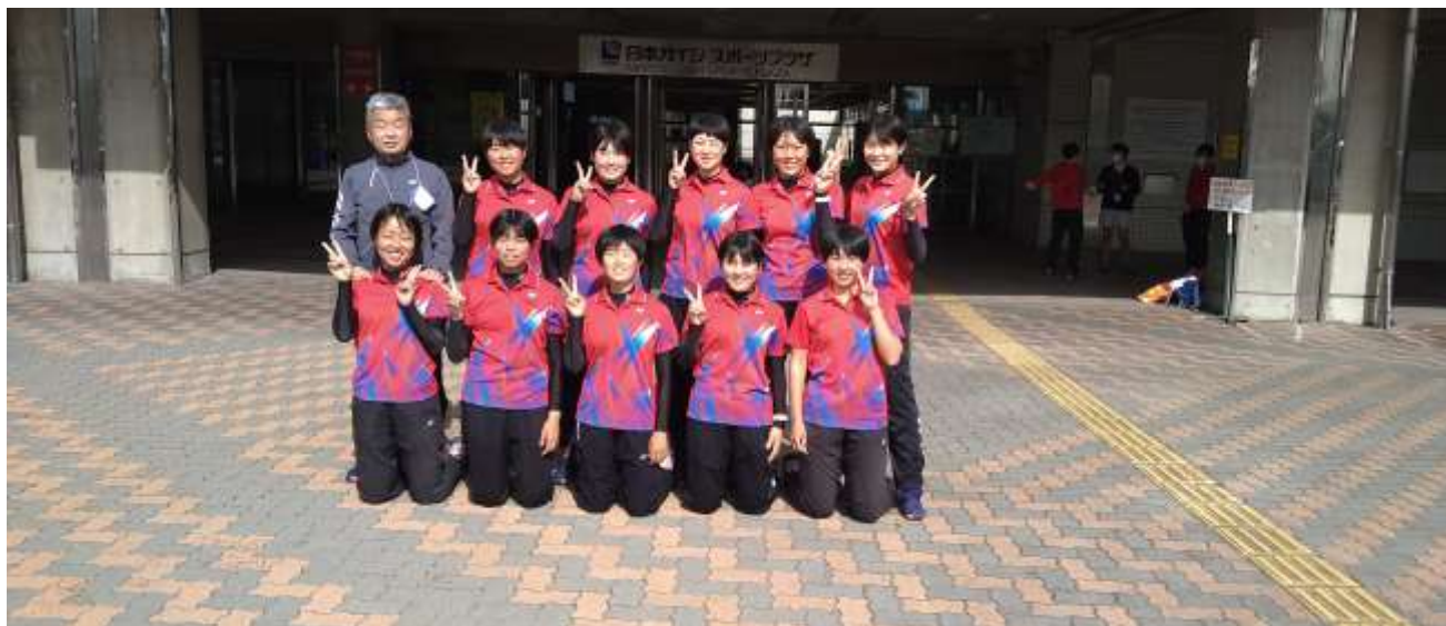
令和3年度関東大会準優勝（栃木県総合運動公園テニスコート）