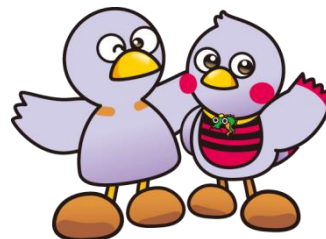
埼玉県のマスコット「コバトン」「さいたまっち」

※ 提出期限後に提出された申請については、認定審査を行いません。奨学金を希望する場合は、期限内に申請書類の提出をお願いします。